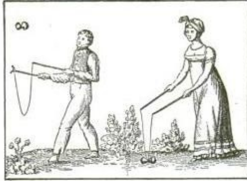
From an Old Print

Diabolo, the fascinating game which, for the past few months, has been the