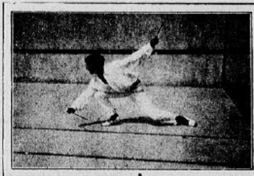
Comment on reçoit une balle basse.