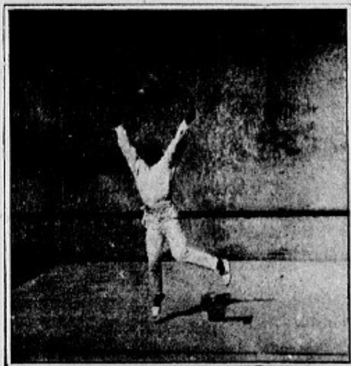
Le lancement d'une balle ou l'effort athlétique.

Celle qui commence doit donner au diabolo un mouvement de rotation, et pour cela elle le pose sur la terre, puis saisissant ses deux baguettes elle glisse la cordelette sur l'axe du Diabolo, de façon à ce que l'appareil se trouve placé au point de jonction de la ficelle et la baguette de droite ; puis brus-