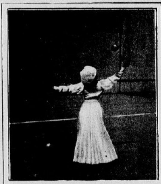
La reprise du diabolo en arrière.

parti à travers l'espace. L'autre joueuse a pour mission de le recevoir et elle le vise quand il est encore en l'air avec la pointe de la baguette de droite. Pour cela elle lève cette baguette verticalement en ayant soin de bien tendre la corde.