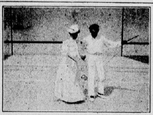
Le jeu à deux avec une seule paire de baguettes.

Et maintenant, décrivons le jeu lui-même. Voici deux joueuses en présence. Elles se mettent sur la même ligne, dans la même direction et à une distance à fixer suivant leur force.